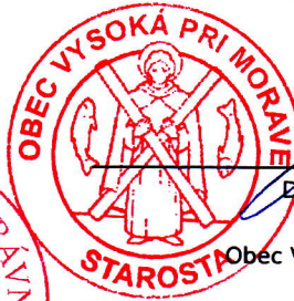
Eušan Dvoran Obec Vysoká pri Morave príjemca